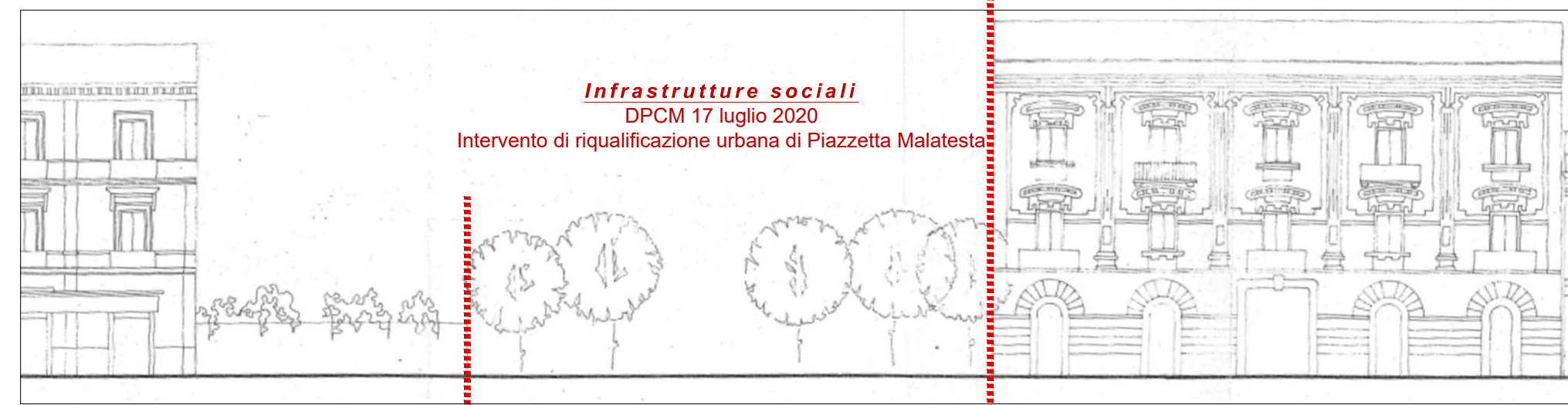
Prospetto sul Corso Ugo De Carolis - individuazione dell'area di intervento